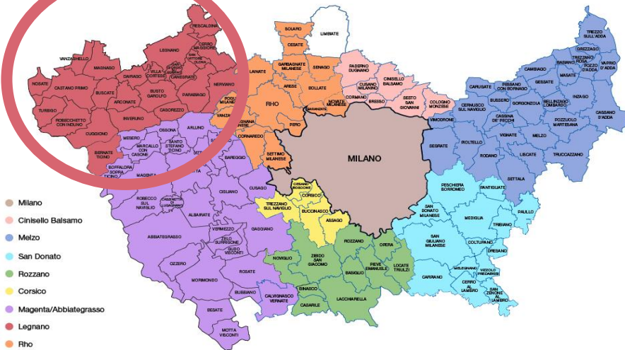
Mappa dei Comuni per l'Impiego e dei Comuni di riferimento