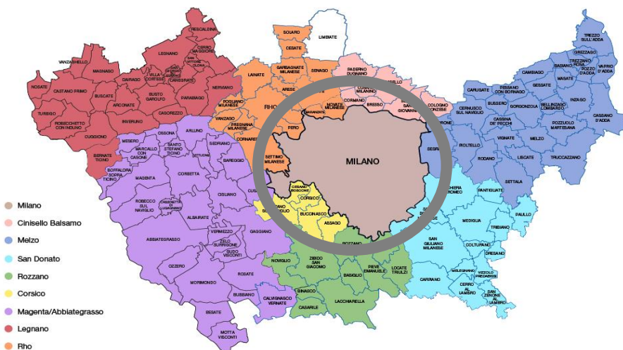
Mappa dei Centri per l'Impiego e dei Comuni di riferimento