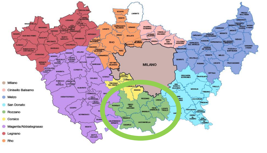
Mappa dei Centri per l'Impiego e dei Comuni di riferimento