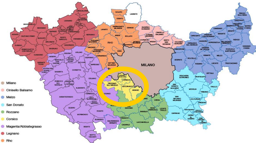
Mappa dei Centri per l'Impiego e dei Comuni di riferimento