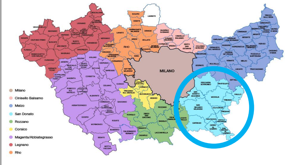
Mappa dei Centri per l'Impiego e dei Comuni di riferimento