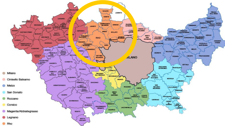
Mappa dei Centri per l'Impiego e dei Comuni di riferimento