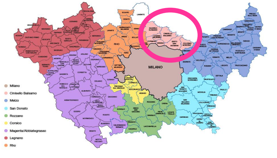
Mappa dei Centri per l'Impiego e dei Comuni di riferimento