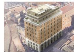
Via delle Botteghe Oscure (Roma)