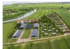
Ca' Tron H-Campus (Roncade - TV)