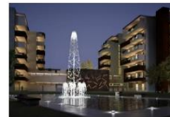
Centro Residenziale Corti Fiorite (Trento)