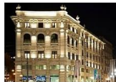
Palazzo Blandrà (Milano)